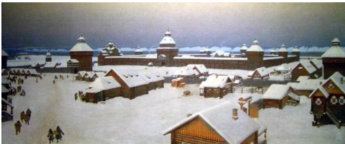
Картина Якутска в начале XIX века. Художник – И. В. Попов

До середины XIX века административно-территориальное устройство Якутска часто реорганизовывали. С 1708 года город входил в Сибирскую губернию, в 1764 году был приписан к Иркутской провинции. В 1822 году Якутск сделали областным городом с пятью округами. В 1851 году управление Якутской областью вверяется гражданскому губернатору. Постепенно в городе растёт численность населения и к концу XIX века достигает семи тысяч человек.