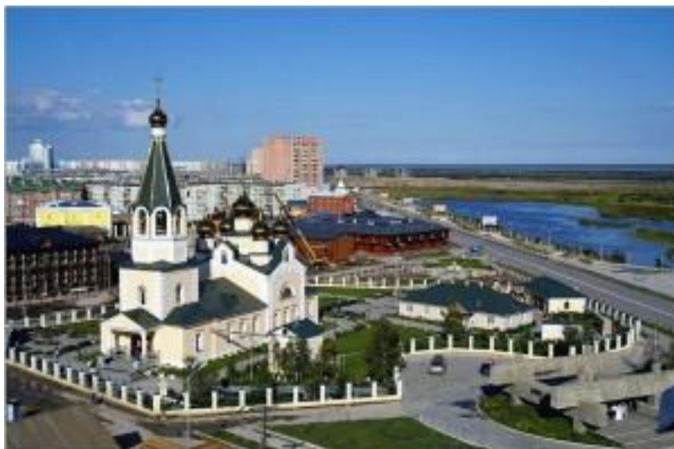
Современный Якутск. Преображенская церковь.

Более подробно узнать об истории города и о современном Якутске можно, пройдя по ссылке https://якутск.рф/cityes