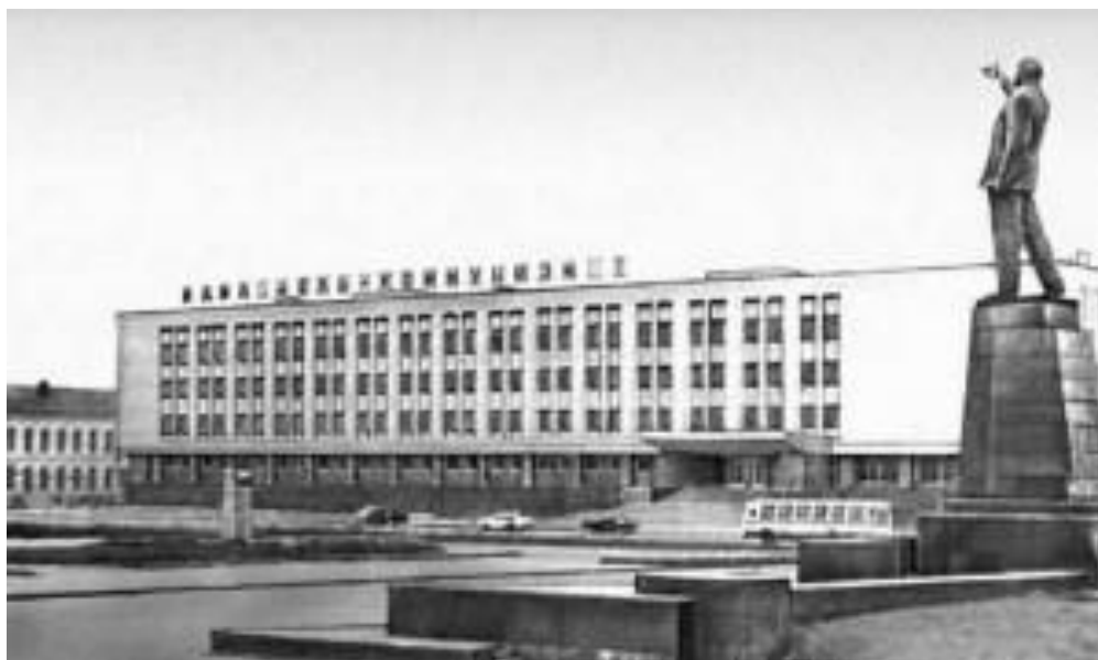
Якутск. Здание Совета Министров Якутской Автономной Советской Социалистической Республики

Сегодня Якутск – столица Республики Саха (Якутия) и является крупнейшим городом на северо-востоке России с населением около 270000 человек (не считая пригороды). Он занимает лидирующее положение в экономике и общественной жизни Якутии. Основу промышленности города составляет производство строительных материалов, заготовка и обработка леса, выделка кожи, пищевая промышленность, добыча каменного угля и выработка электроэнергии.