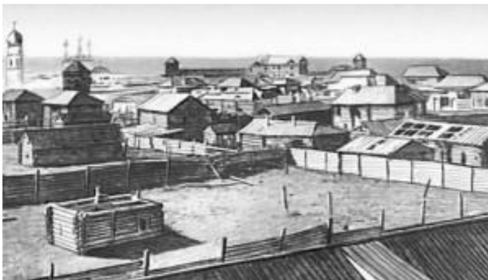
Общий вид Якутска во второй половине XIX века

Согласно статистике, в начале XX века в Якутске числились 930 жилых домов, в том числе 79 якутских юрт, имелись 8 каменных и 8 деревянных православных церквей, синагога. Были открыты 16 учебных заведений, областной статистический комитет с областным музеем, казённая типография, две библиотеки. В 1913 году в городе был образован отдел Русского географического общества.